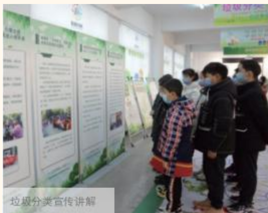
垃圾分类宣传讲解