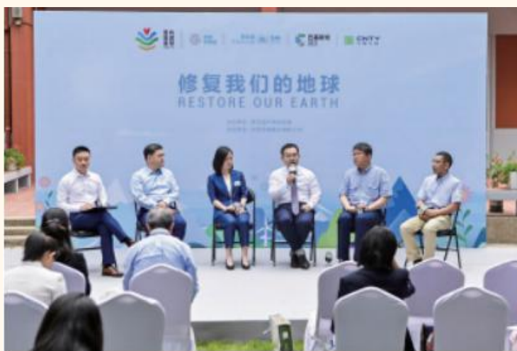
公司参加联合国环境规划署驻华代表处举办的世界环境日主题活动

公司的发展离不开健康和谐的社会环境，公司始终以回报社会为己任，积极投身社会公益事业，将关爱社会作为企业文化建设的一项重要组成部分，在公司快速发展的同时，始终坚持“为顾客创造价值，为股东创造财富，为员工创造利益，为社会创造繁荣”，将企业使命和社会责任相结合，身