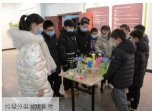
垃圾分类游戏体验

作为专注于环境保护的上市公司，公司的环境服务水平和质量影响千家万户，其中与社区的沟通和交流也尤其重要。公司每年发布社会责任报告，披露企业社会责任建设年度状态，使公众了解上一年度公司对社会责任的承担情况；定期开展世界环境日等环保主题开放日活动，邀请社会各界人士参观交流、邀请厂区周边居民实地走访生产一线、联系学校组织中小學生进行环