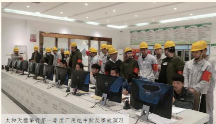
天和天楹举行第一季度厂用电中断反事故演习

急处置、快速反应、分级负责、协调一致的原则，坚持做到作业过程中一旦出现重大安全事故及重点安全风险，