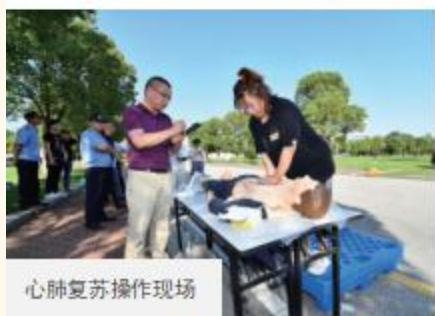
心肺复苏操作现场