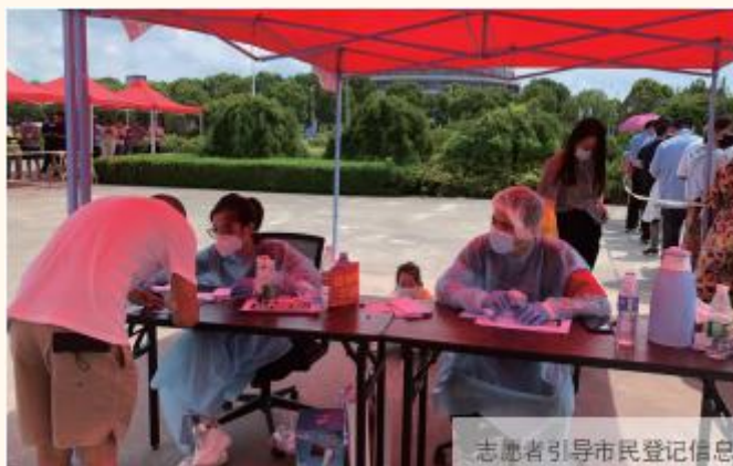
志愿者引导市民登记信息

2021 年年中，公司积极响应海安市新冠肺炎疫情防控指挥部的号召，投入到海安市全员核酸检测实战中，成为全市 259 个核酸检测采样点之一，附近数千居民和企业职工在中国天楹接受了核酸检测采样。