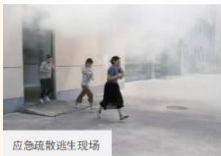
应急疏散逃生现场