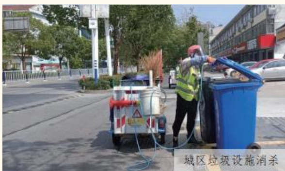
城区垃圾设施消杀

战在抗击疫情的第一线。环卫工人们对接桶、果壳箱等垃圾设施消杀出清，围绕设施点位周边进行人机结合冲洗出净持续对城区主干道、公园广场等公共区域进行细致、精准的地毯式消杀作业，并重点加强中转站箱体、环卫作业车辆消杀，为打赢疫情保卫战奠定基础。