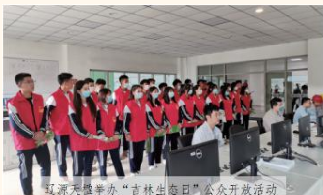
辽源天楹举办“吉林生态日”公众开放活动

针对垃圾焚烧发电项目和医废处置项目，公司坚持科学、规范地运营，建立、健全各项环保规章制度，并严格按照国家有关标准、环