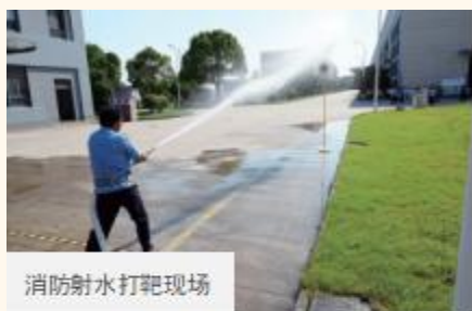
消防射水打靶现场

能够迅速、快捷、有效的启动应急救援系统。公司通过强化日常安全监督检查及现场管理，落实各级安全责任，查堵各种事故隐患，降低事故的后果，减少人员伤亡、财产损失和环境破坏。